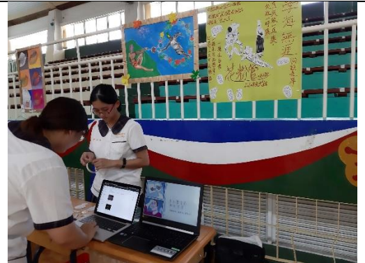
講解我們的成果給學弟妹們