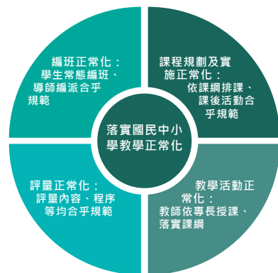
圖5 落實國民中小學教學正常化的相關措施

教育部發布「國民中小學教學正常化實施要點」，透過落實編班、課程規劃、教學活動及評量等正常化措施(如圖5)，以期達到教學正常化的目標。