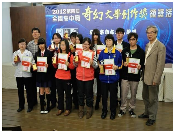
學校辦理專案計畫之相關資訊